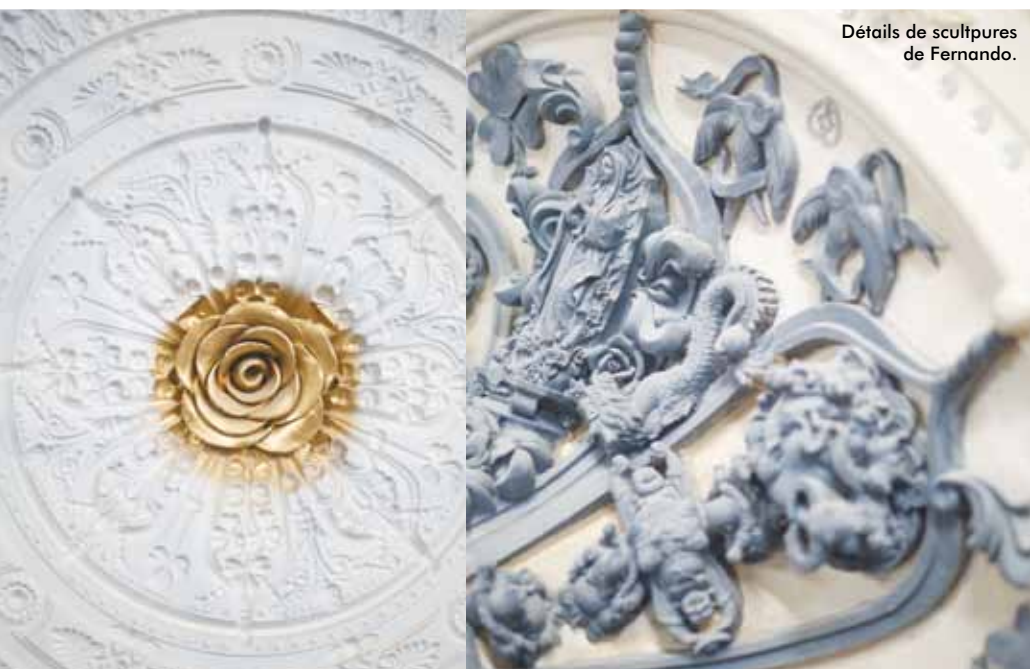
Détails de sculptures de Fernando.