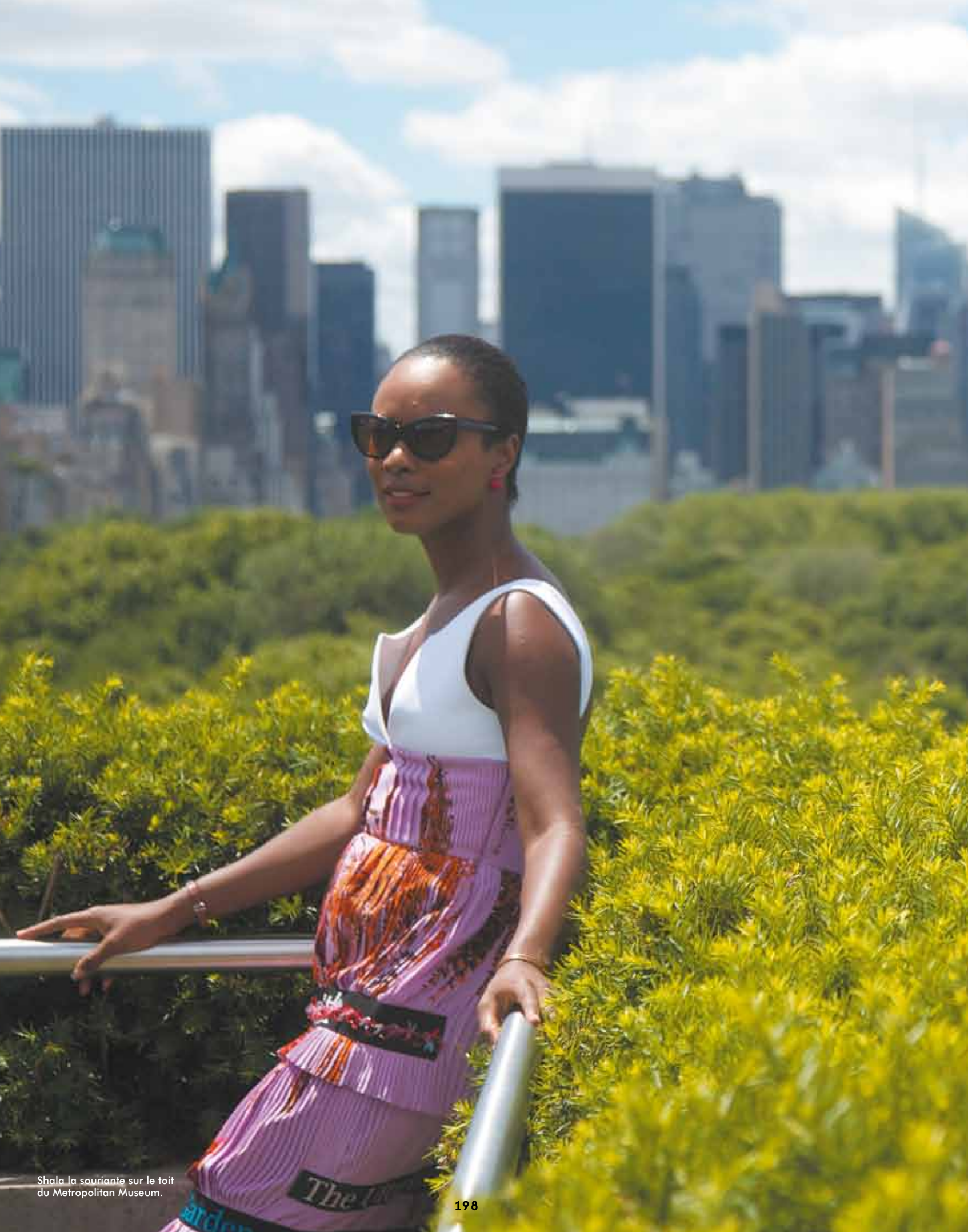
Shala la souriante sur le toit du Metropolitan Museum.